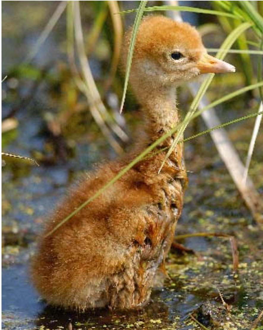
Portret kilkudniowego pisklęcia żurawia ( Grus grus ).