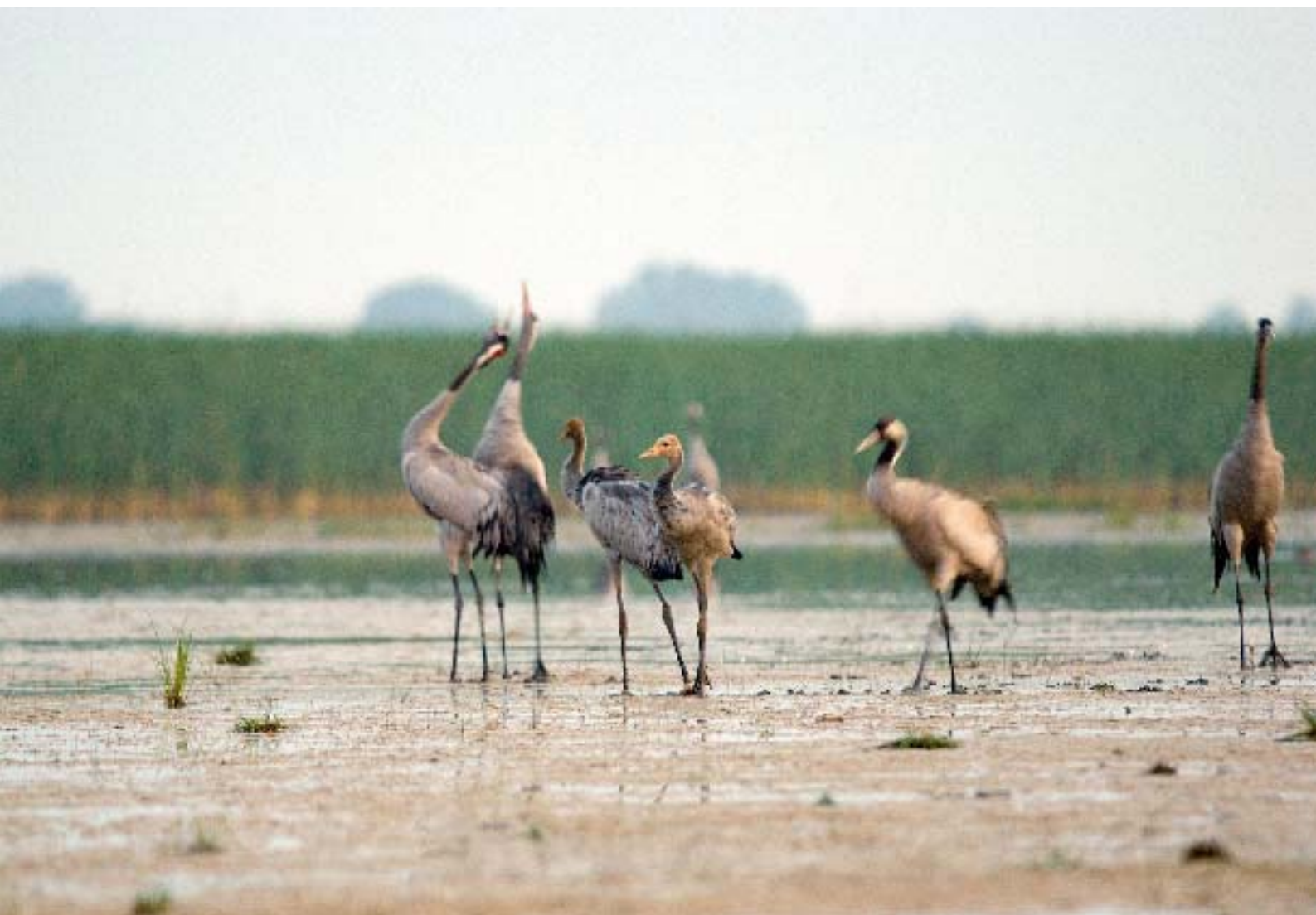
Żurawie w płytkiej zatoce Jeziora Liwieniec. Szczególnie o świcie donośnym klangorem oznajmiają swoją obecność na lęgowisku. Na środkowym planie młode żurawie, nieloty.